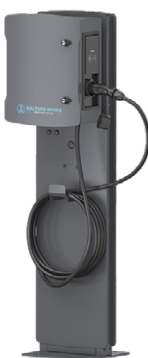
Zubehör: 6410047 | Stele für smarte Wallbox 3703090 | Walther Erdstück für Stele

Alle Niederlassungen und Ansprechpartner unserer Sonepar-Gesellschaften finden Sie im Internet unter www.sonepar.de/vorOrt