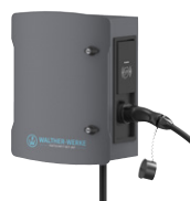
Walther Werke smarte 22 KW Wallbox festes Ladekabel Typ 2 7210521 Modem, Modbus TCP und RTU, Überspannungsschutz