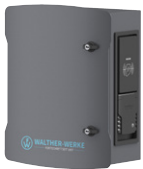
Walther Werke smarte Wallbox Steckdose Typ 2 11 kW 7210512

Walther Werke smarte Wallbox (inkl. DC-Fehlerstromerkennung, Leitungsschutzschalter und Typ A FI), bidirektionaler Energiezähler (MID-zertifiziert), Powerline Communication PLC (ISO 15118 – ermöglicht Plug & Charge und bidirektionale Kommunikation mit dem Fahrzeug), EEBus-fähig (Integration ins Smart-Home), Abrechnen von Firmenfahrzeugen von Zuhause (Auslesen der Ladevorgänge über App), Smart-Grid-Fähigkeit durch OCPP 1.5 & 1.6 (JSON & SOAP), dyn. Lastmanagement vorbereitet, Modbus TCP