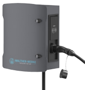
Walther Werke smarte Wallbox festes Ladekabel Typ 2 11 kW 7210513