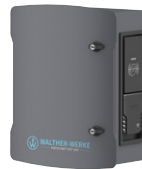
Walther Werke smarte 22 KW Wallbox Steckdose Typ 2 7210517 Modem, Modbus TCP und RTU, Überspannungsschutz